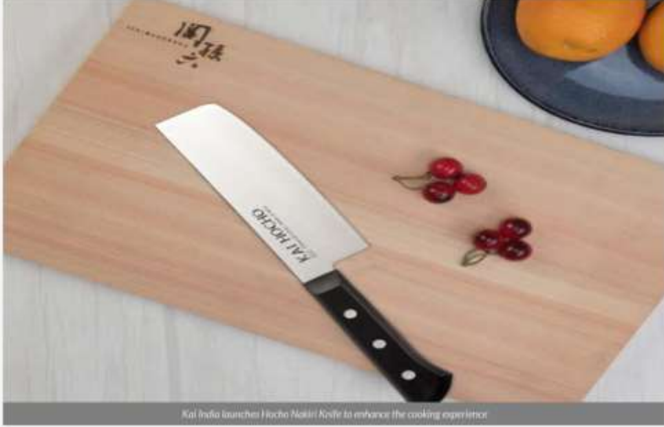
Kai India launches Hocho Nakiri Knife to enhance the cooking experience